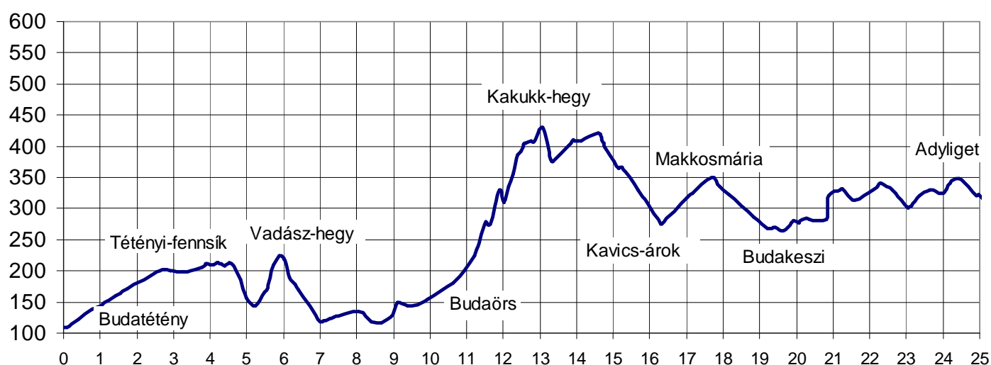
Buda határán 50, 25/B teljesítménytúra hosszmetszete